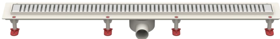
Рис.4 – Решетка тип Д «Полосы»

Партия трапов, поставляемая в один адрес, комплектуется паспортом и объединенным техническим описанием в соответствии с ГОСТ 2.601-2006.