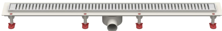
Рис.5 – Решетка тип D «Полосы»

Партия трапов, поставляемая в один адрес, комплектуется паспортом и объединенным техническим описанием в соответствии с ГОСТ 2.601-2006.